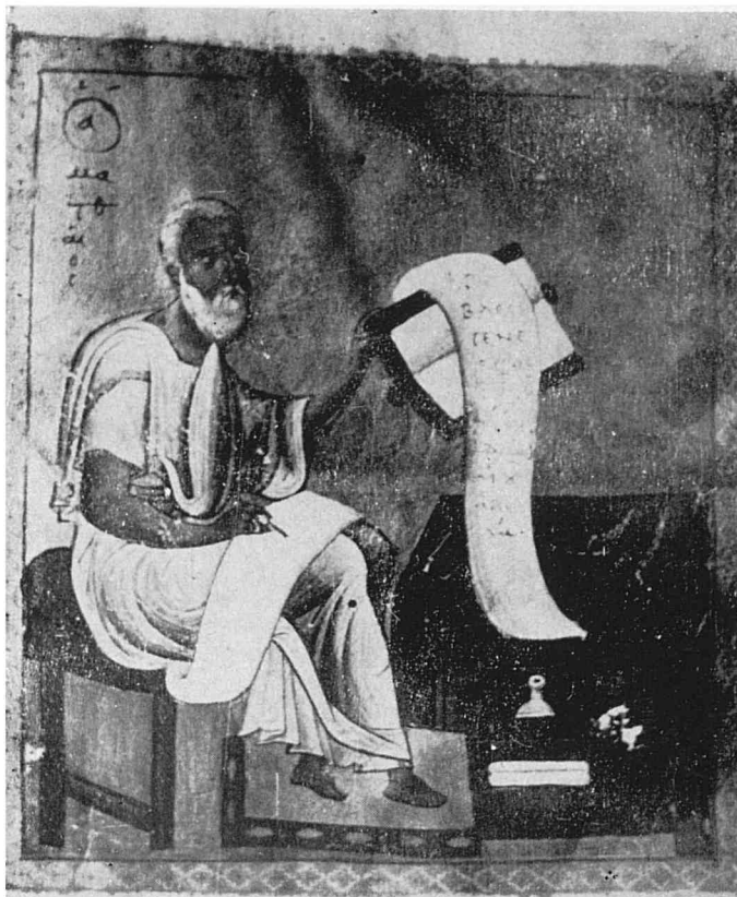
Рис. 1. Евангелист Матфей, ГИБ, греч. 72, л. 13 об.