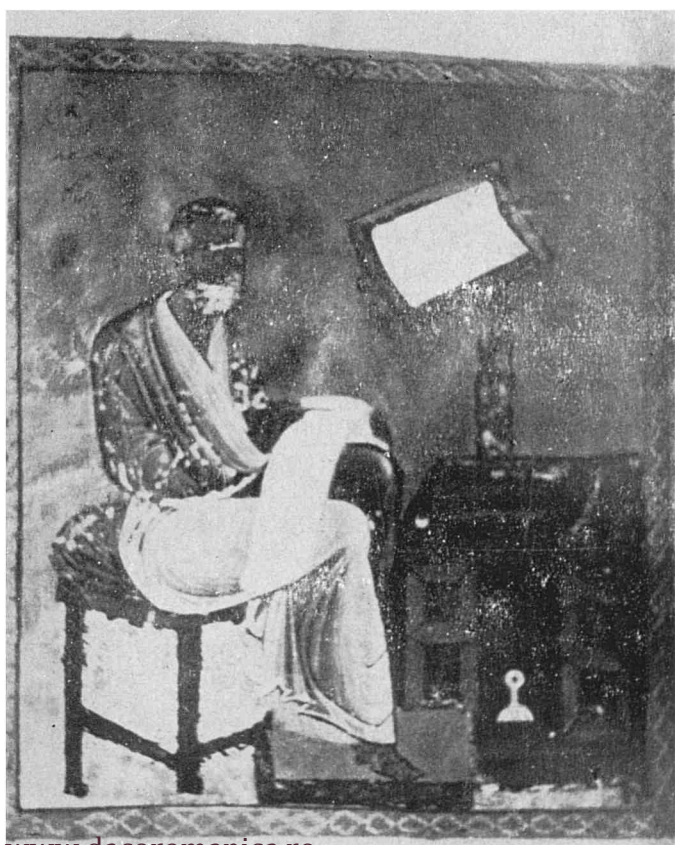
Рис. 2. Евангелист Марк, ГИБ, греч. 72, л. 123 об.