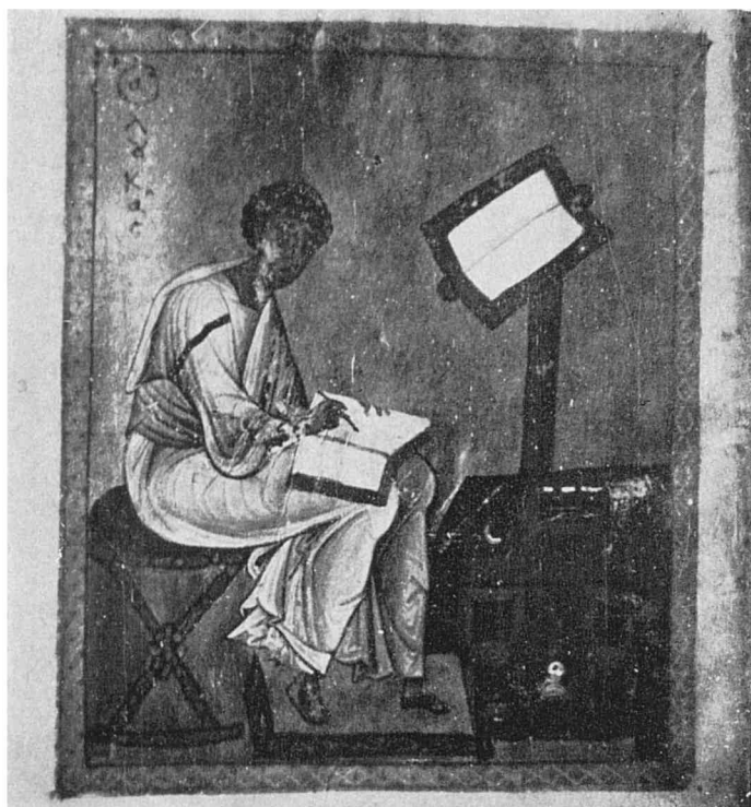
Рис. 3 Евангелист Лука, ГИБ, греч. 72, л. 178 об.