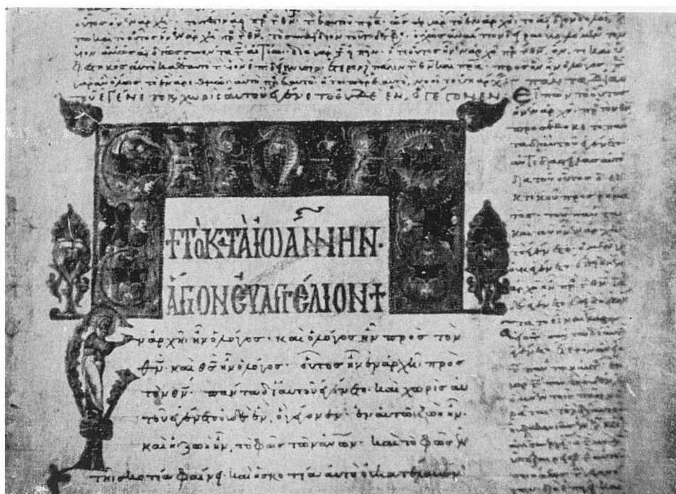
Рис. 5. — Заставка и фигурный инициал Четвероевангелия 1061 г., ГИВ, греч. 72, л. 272.