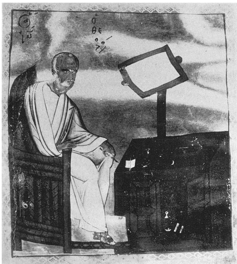
Рис. 4 Евангелист Павел Богослов, ГИБ, греч. 72, л. 270 об.