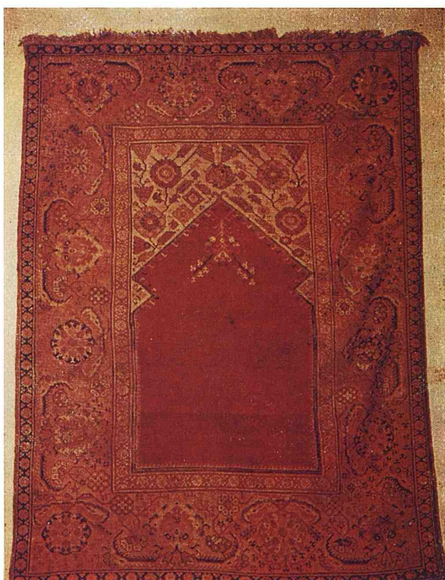
Fig. 3 Tapis de prière de Transylvanie. XVII e siècle. 176 × 132 cm.