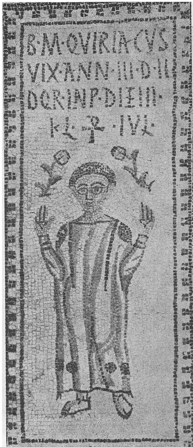
Fig. 1 — Mosaïque funéraire représentant un enfant de trois ans, nommé Quiriacus (Tunis, Art. paléochrétien).