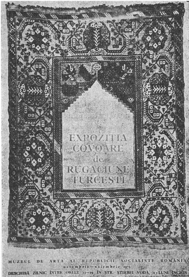
Fig. 1 — Affiche de l'exposition, ornée d'un tapis de Transylvanie du XVII e siècle 160 x 170 cm.

Les tapis tures posent de nombreuses questions à l'histoire de l'art roumain et nous avons déjà mentionné le problème de l'origine des tapis de Transylvanie, destinés à décorer les églises dépourvues de peintures de la Réforme. Donations de la part des patriciens, des guildes, des familles d'artisans et de marchands aisés, en signe de leur opulence, ils forment encore de riches collections à l'intérieur de l'Eglise Noire de Braşov, des églises évangéliques de Sibiu, de Sebeş-Alba, de Biertan. etc.