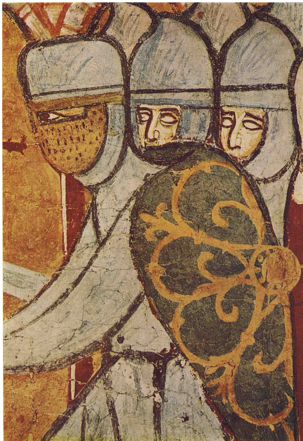
Fig. 1 Fresque représentant le martyre de Saint-Thomas Becket (Treviso, Museo Diocesano, XIII e siècle, Catalogue Venezia e Bisanzio n o 59).