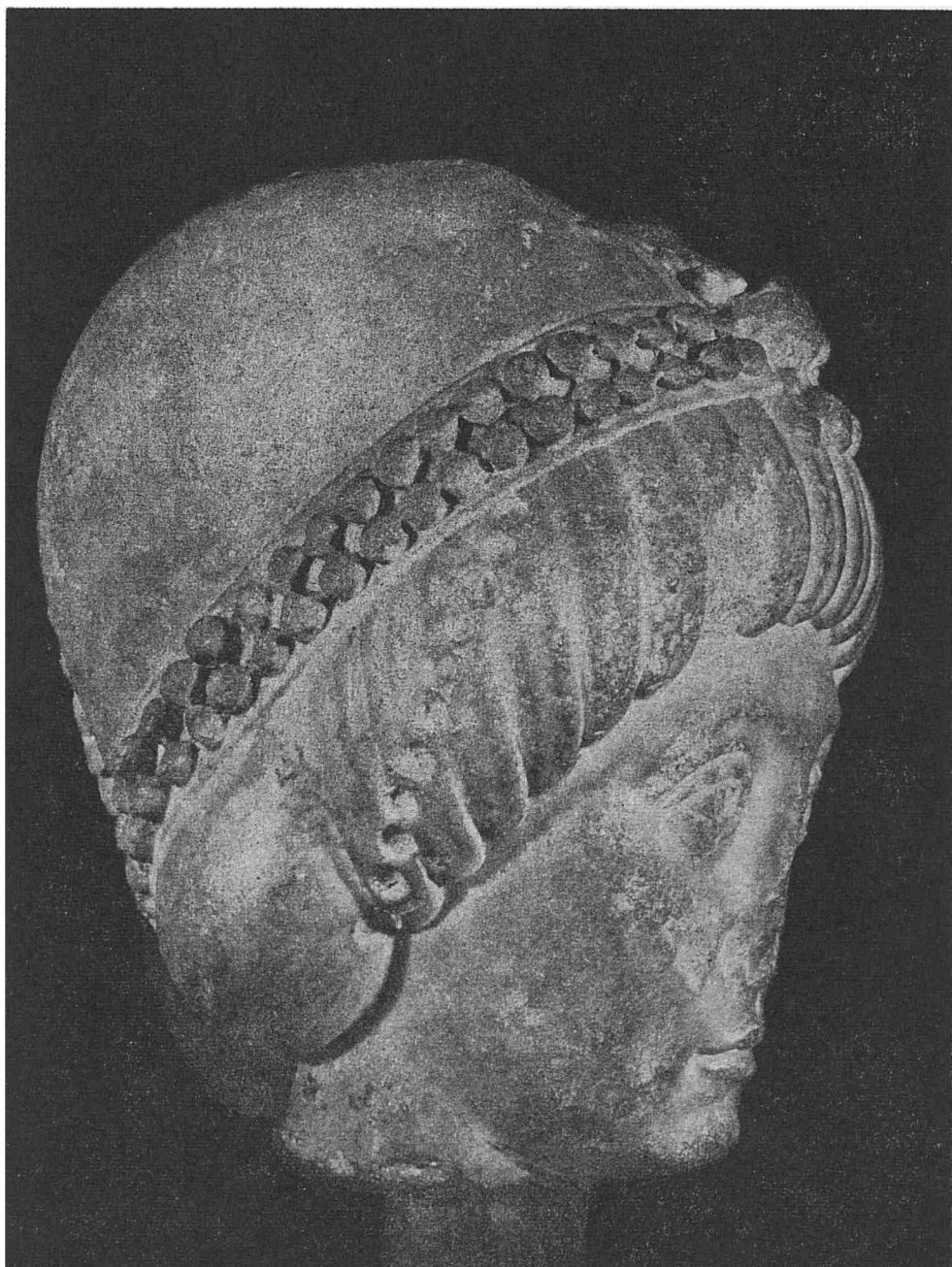
Fig. 2 — Portrait de femme représentant, d'après Delbrueck, l'impératrice Théodore et, d'après Peirce-Tyler, Justine (Milan, Castello Sforzesco, Catalogue Venezia e Bisanzio n° 11).