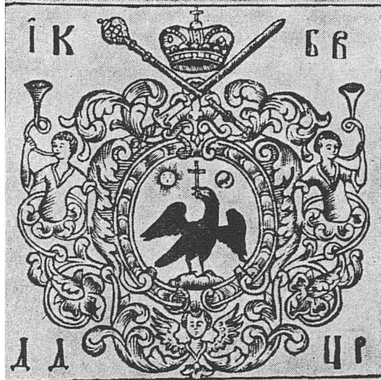
Fig. 1. Les armoiries de la principauté de Valachie imprimées sur le verso de la page de titre de Noul Testament , (Nouveau Testament) paru à Bucarest, 1703.

de l'art du blason ont été respectés. Ainsi l'aigle sera placé de profil à dextre (quoique à l'époque l'oiseau valachique est souvent contourné), la couronne qui timbre l'aigle ou l'écu présente généralement l'aspect familier des couronnes ouvertes spécifiques des voïvod es roumains. L'usage d'une manière expresse des armes traditionnelles valaques à une époque où, dans l'héraldique sigillaire on signale fréquemment le type combiné, réalisé par l'emplacement