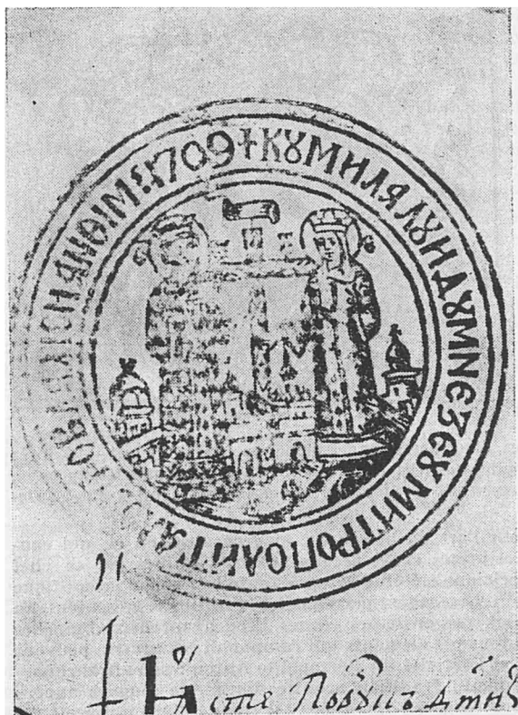
Fig. 2. Le grand sceau utilisé par le métropolitain Antim Ivireanul.

Corroborant l'aspect de ces armoiries avec celui des emblèmes qui représentent autant les saints Constantin et Hélène ayant derrière eux les murailles d'une ville-forteresse (pour sûr la ville de Bucarest, qui avait comme patrons les deux saints mentionnés) 14 , qu'une figure chymérique (un serpent à tête de haut prélat) ou bien une tiare, nous constatons que les armes chargées du limaçon posé en pal et accompagnées des attributs de l'épiscopat, ont été composées seulement vers la fin de la vie du prélat, lorsque celui-ci travaillait à la réalisation du monastère portant son nom.