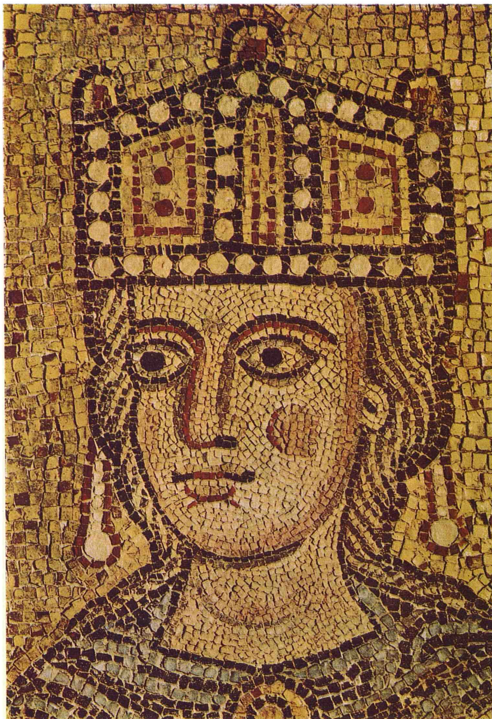
Fig. 3 – Mosaïque représentant Ecclesia romana (Roma, Palazzo Braschi, XIII e siècle, Catalogue Venezia e Bisanzio n° 58).