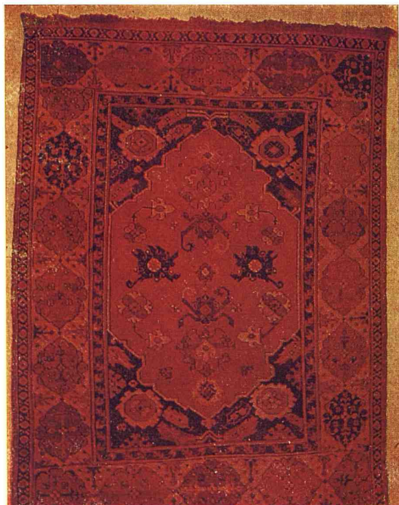
Fig. 2 - Tapis de Transylvanie à double niche. XVII e siècle, 169 × 125 cm.