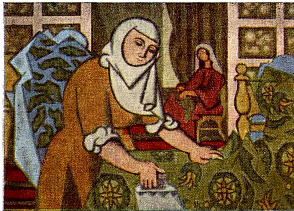
2. La Repasseuse