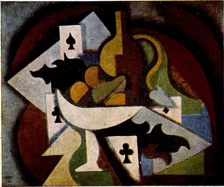
1. Nature morte aux cartes